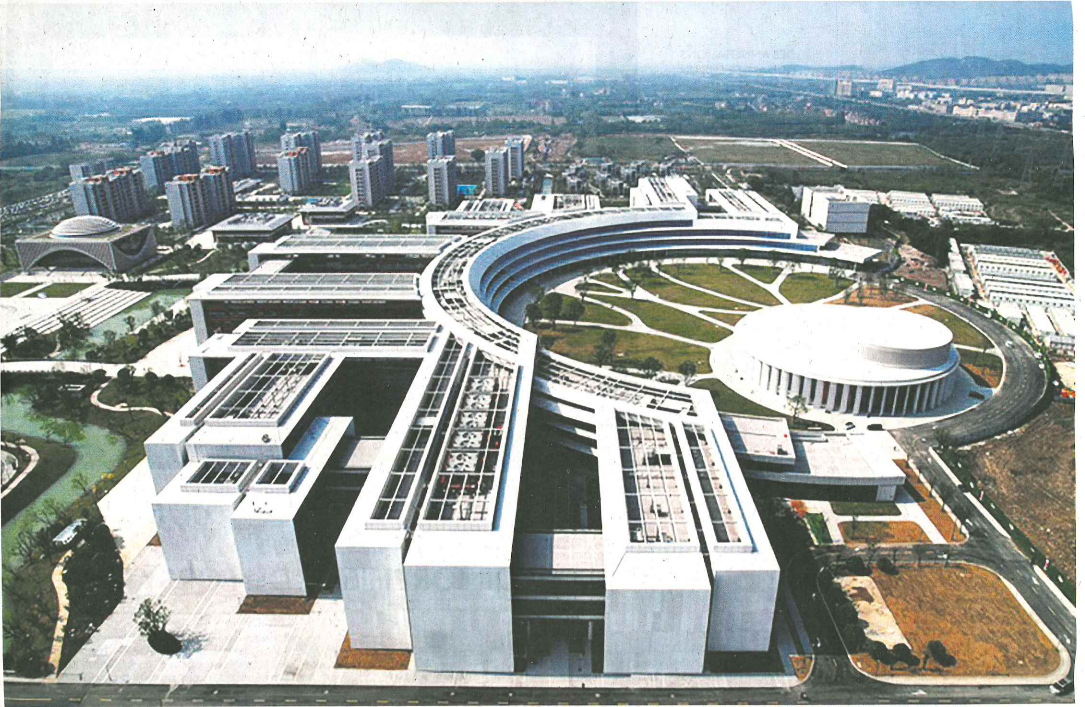
L'université Westlake, à Hangzhou, dans la province du Zhejiang (Chine), le 23 octobre 2021.

tre, préféraient très largement – et c'est encore souvent le cas – aller étudier un temps aux Etats-Unis, en Europe, en Australie ou à Hongkong. En 2015, le plan baptisé « Doublement au premier rang » a été lancé pour pousser la performance des meilleures universités et la réussite dans certaines disciplines choisies, à une période où les plus hauts cadres du Parti communiste ont eux-mêmes pour beaucoup étudié l'ingénierie, dont les présidents successifs Jiang Zemin (1926-2022), Hu Jintao et Xi Jinping.